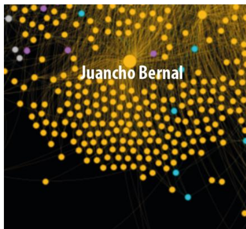
Figura 4: Comunidad alrededor de la cuenta @JuanchoBernalID (MrMister)

Resulta curioso observar cómo numerosas cuentas vinculadas a Otro Camino interactúan de manera limitada, enfocándose principalmente en relaciones directas con el partido o el candidato. Es decir, no establecen muchas conexiones más allá de su relación con el partido político. No estamos insinuando necesariamente que algunas de estas cuentas puedan ser falsas, aunque esa posibilidad nunca puede descartarse por completo (aunque, de ser así, su impacto sería menor). Parece más bien que se trata de un esfuerzo meticuloso por construir y mantener una red de relaciones por parte de los políticos y miembros del espacio político, especialmente notable durante las protestas, las cuales supieron capitalizar tímidamente.