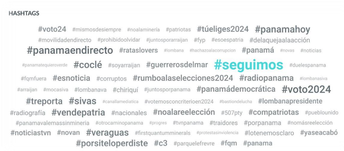
Figura 1: Principales hashtags alrededor de la comunidad de Otro Camino durante noviembre y diciembre 2023.

Para el análisis, se recolectaron datos de las interacciones en las redes sociales relacionadas con Otro Camino, particularmente en Twitter, durante noviembre y diciembre de 2023. El propósito fue determinar las principales redes de comunicación y patrones de conducta en línea dentro de este escenario político y social.